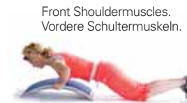
Front Shouldermuscles. Vordere Schultermuskeln.