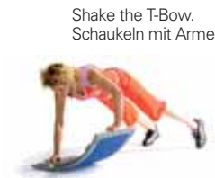
Shake the T-Bow. Schaukeln mit Armen.