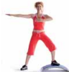
chassé: Sidejump over T-Bow. Wechselschritt über T-Bow.