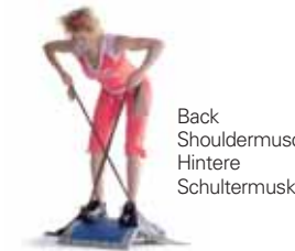
Back Shouldermuscles. Hintere Schultermuskeln.