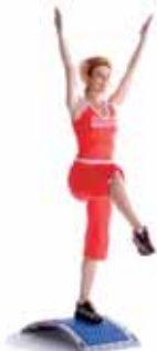
step knee: Step up and knee up. Schritt hoch und Knie hoch.