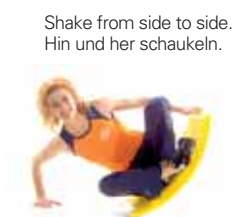
Shake from side to side. Hin und her Schaukeln.