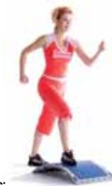
basic: Step up and down. Auf- und absteigen.

Stepübungen und Gelenke mobilisieren, Muskeln kurz dynamisch aktiv eindehnen.