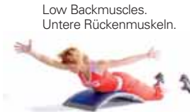
Low Backmuscles. Untere Rückenmuskeln.