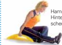
Hamstrings. Hintere Oberschenkelmuskeln.