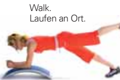
Walk. Laufen an Ort.