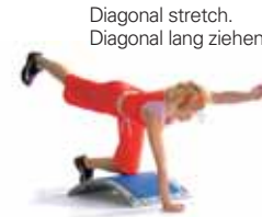
Diagonal stretch. Diagonal lang ziehen.