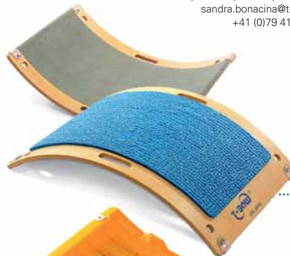
T-BOW® WOOD dim.: 70 x 50 x 18 cm weight: 4,5 kg