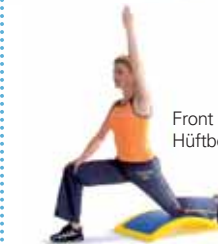
Front Hipmuscles. Hüftbeugermuskeln.