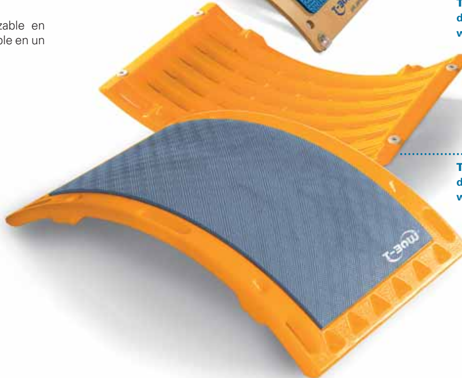
T-BOW® PLASTIC dim.: 70 x 50 x 16 cm weight: 3,2 kg

Viktor Denoth Produktentwicklung Hochschulsportlehrer viktor.denoth@t-bow.ch +41 (0)76 396 00 64